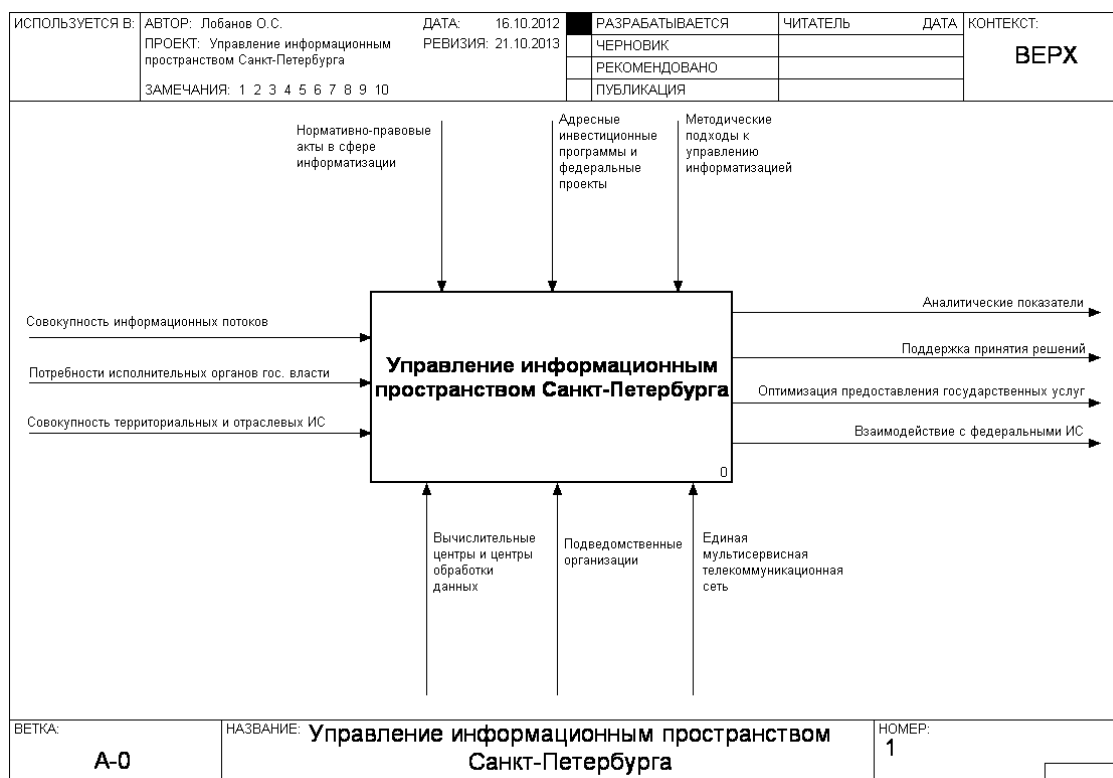
Рис. 2: Контекстная модель построения системы управления информационным пространством Санкт-Петербурга