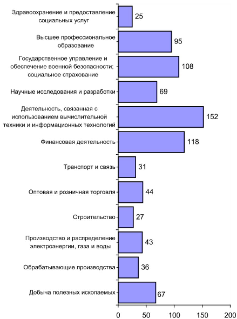
Рис. 1: Уровень оснащённости персональными компьютерами по отдельным видам экономической деятельности (единиц на 100 работников списочного состава)