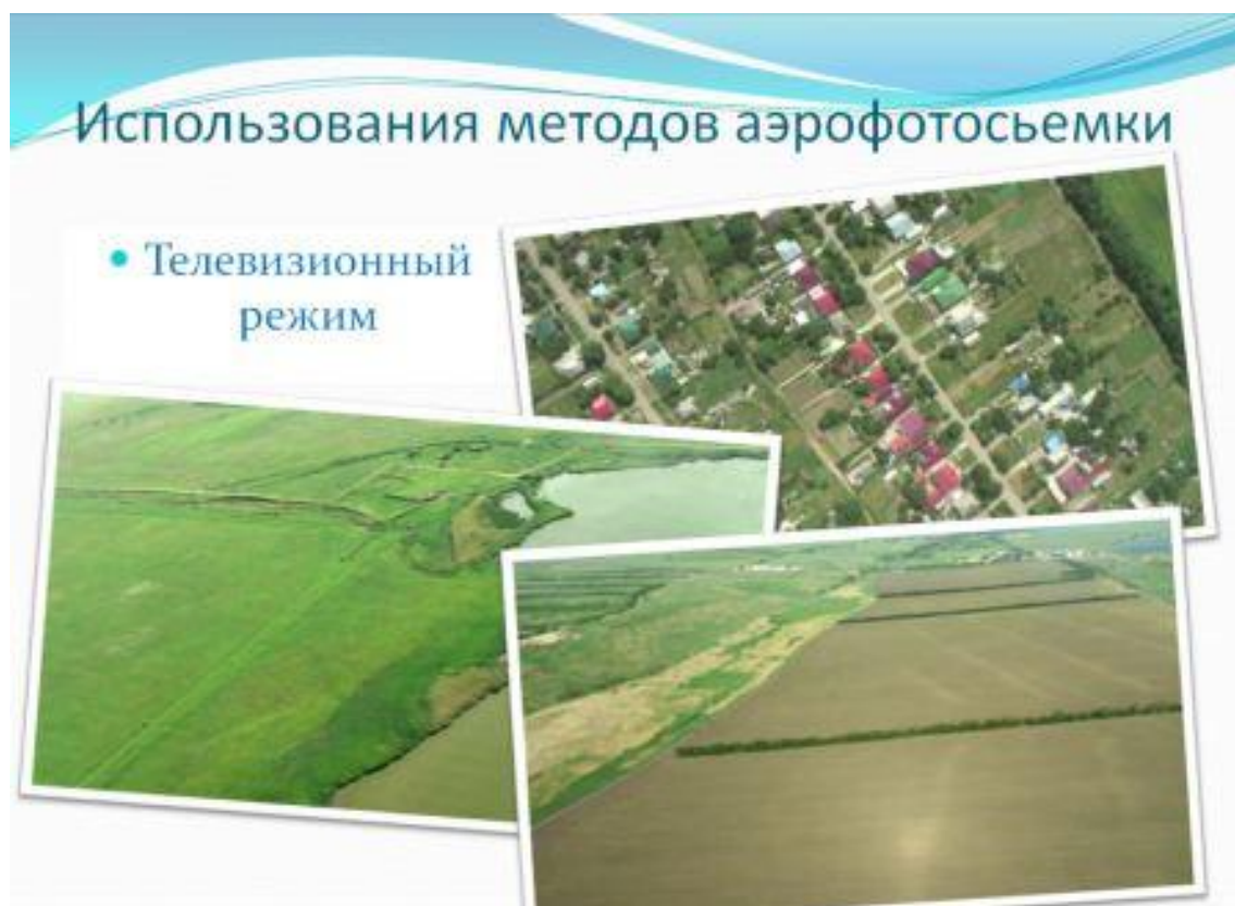
Рис. 1: телевизионный режим съемки