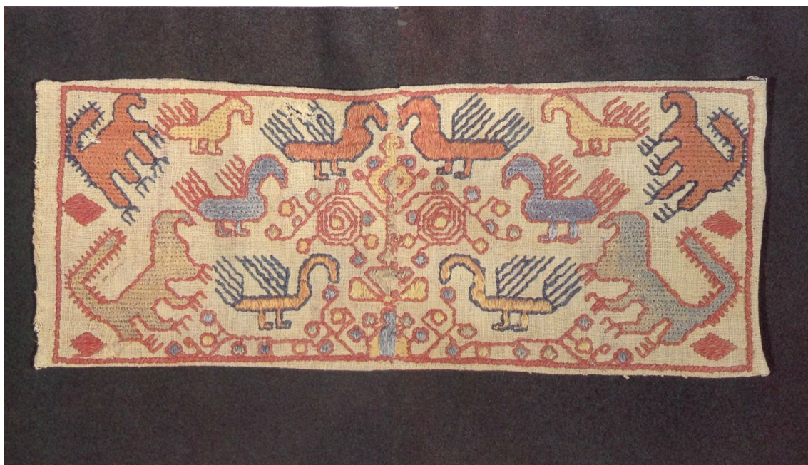
Рис. 1: Образец сквозной вышивки