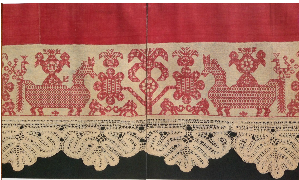
Рис. 2: Образец вышивки с изображением коней