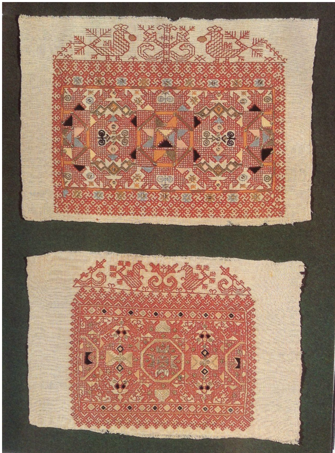
Рис. 3: Образец древнерусской огненной символики