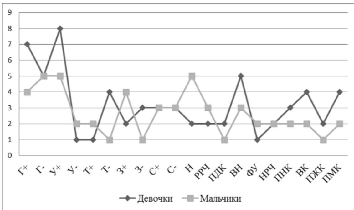
Рис. 2. Рис. 1. Количественная представленность нарушений воспитательного воздействия: гиперпротекция (Г+), потворствование (У+), недостаток требований – обязанностей (Т-), чрезмерность требований – запретов (З+), недостаток требований – запретов (З-), неустойчивость стиля воспитания (Н), воспитательная неуверенность родителя (ВН), вынесение конфликта между супругами в сферу воспитания (ВК), предпочтение мужских качеств (ПМК)