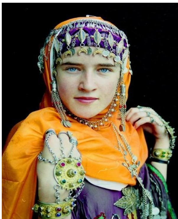
Рис. 4. Балхарка в традиционном костюме