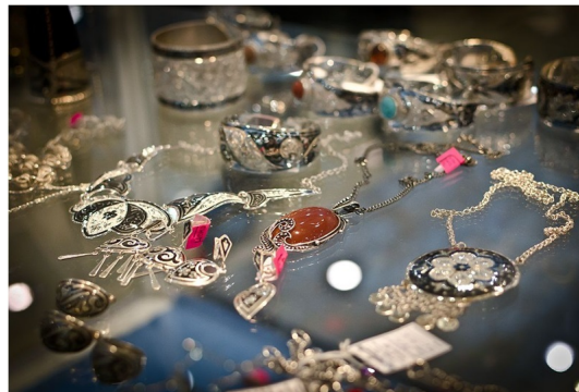
Рис. 2. Реализация изделий выпускников ХГФ. Махачкала