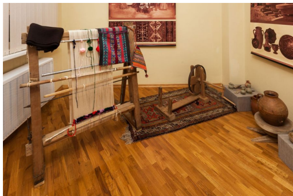
Рис. 3. Реконструкция традиционного интерьера