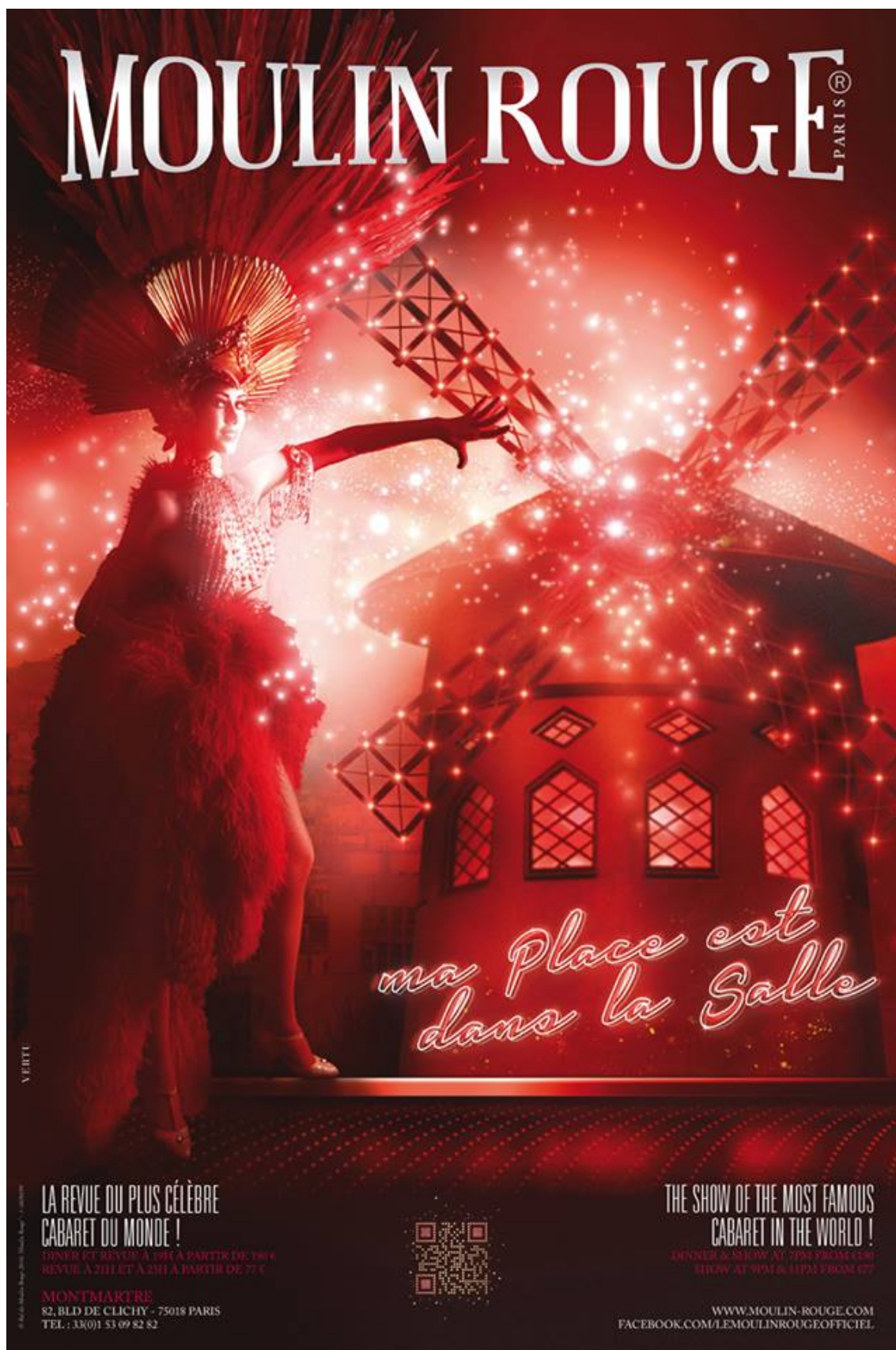
Рис. 2. Современная афиша "Moulin Rouge"