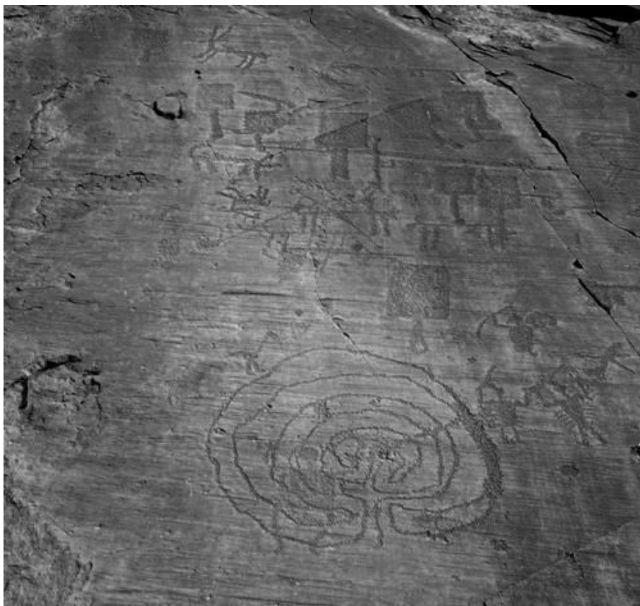
Рис. 6. Петроглиф в Брешии