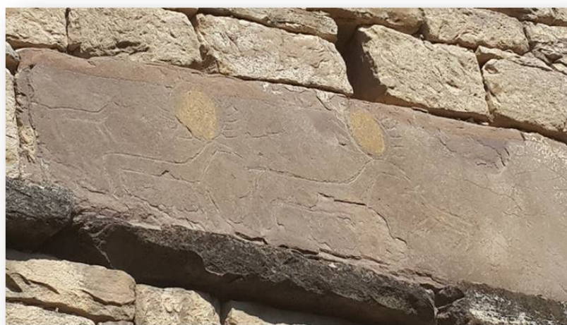
Рис. 4. Олени с солнцем в рогах. Кладка стены Кахибской мечети