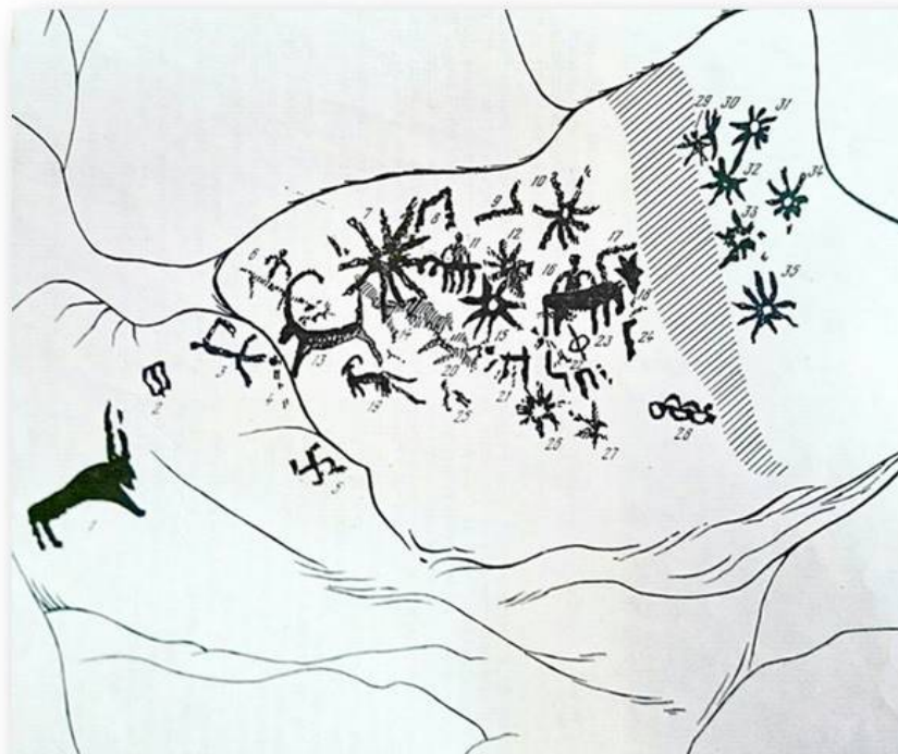
Рис. 3. Чувал-Хвараб-нохо. Пещера, где нарисованы лошади