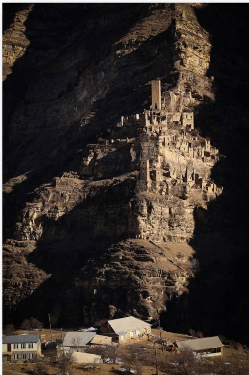
Рис. 7. Вид на Старый Кахиб