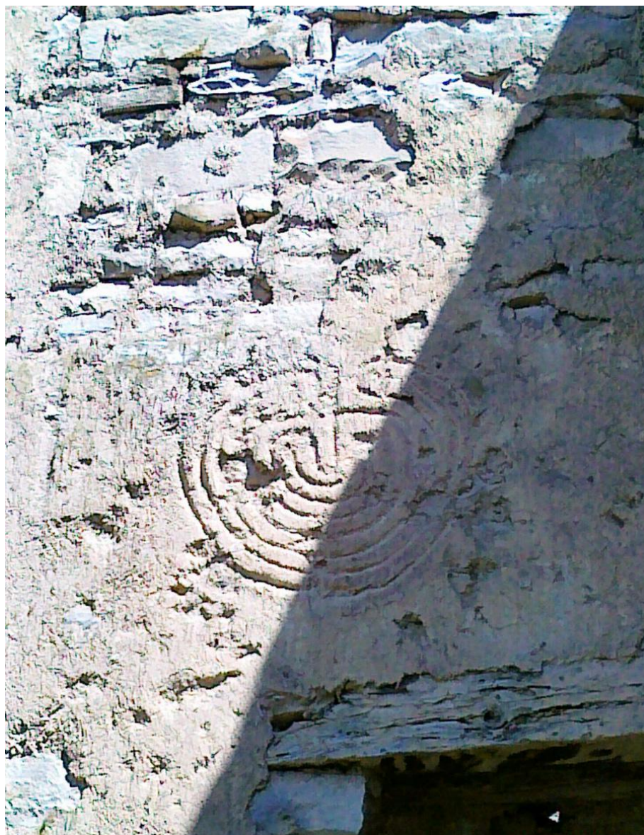
Рис. 5. Рельеф на стене Кахибской мечети