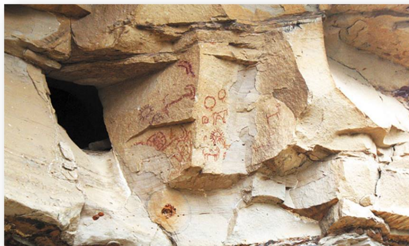
Рис. 1. Росписи грота Чинн-Хитга близ Согратля