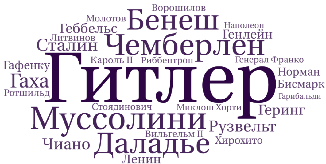
Рис. 3. Инфографическое изображение категории «Личности»