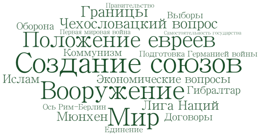
Рис. 4. Инфографическое изображение категории «Основное содержание»