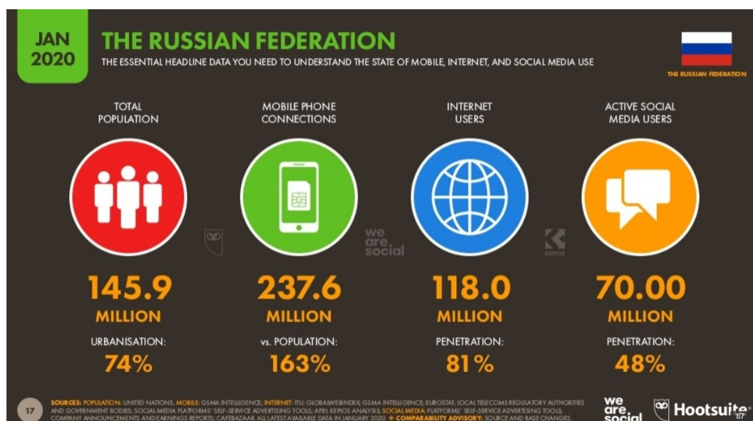
Рис. 2. Количество интернет-пользователей в России (январь 2020 г.)