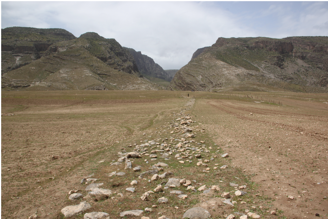
Рис. 2. Остатки стены у ущелья Иллалик.