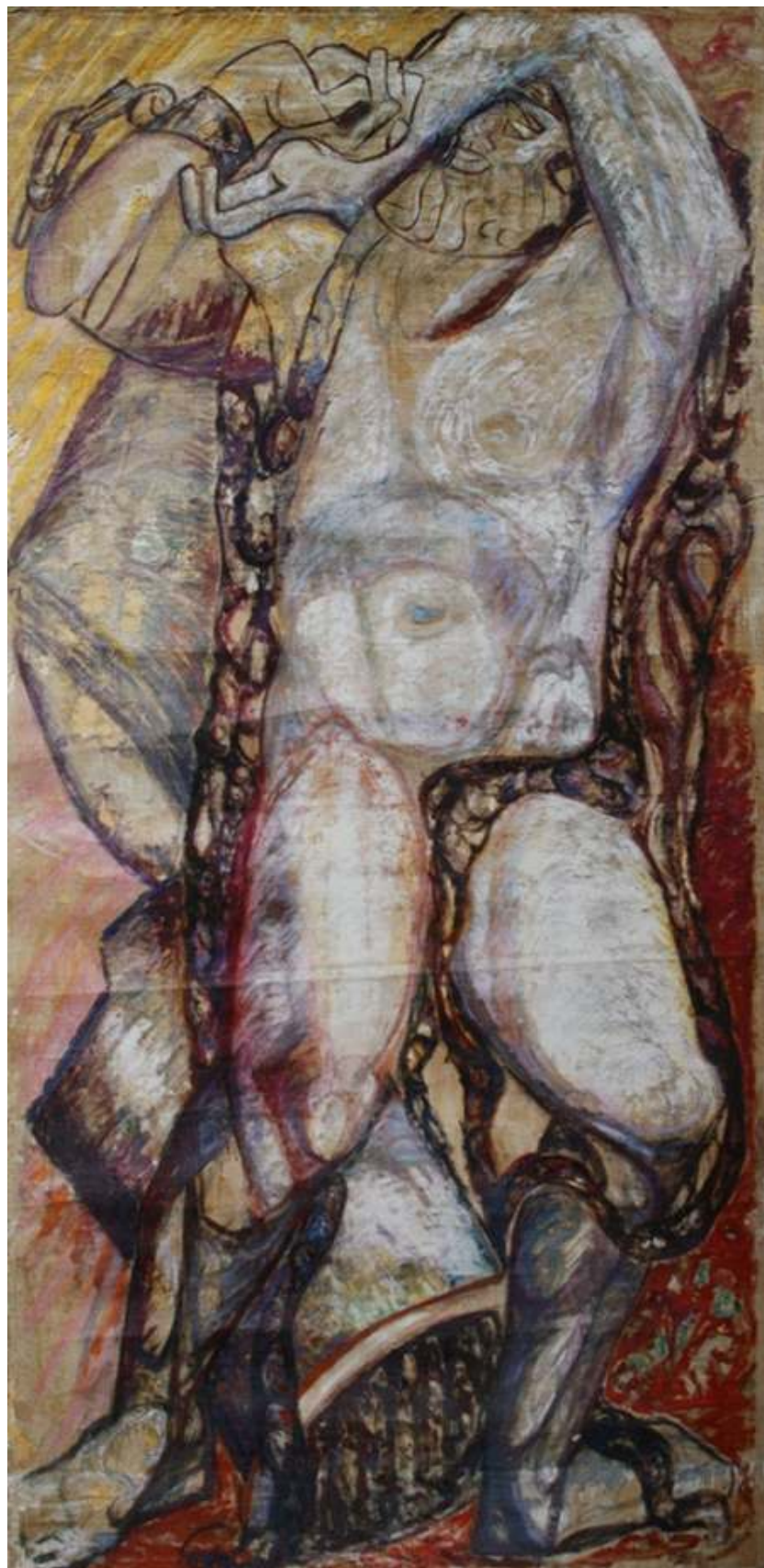
Рис. 4. Денисов. В.И. Самсон разрывающий цепи. Холст, масло. ГТГ