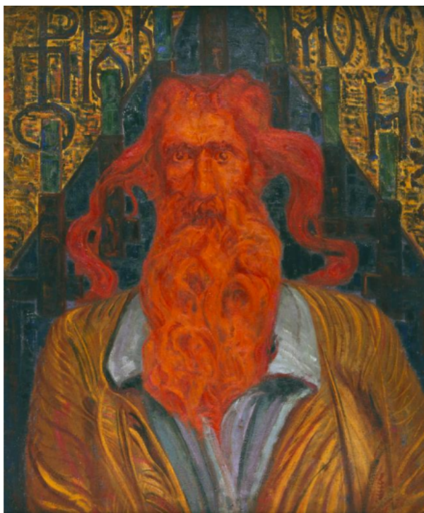
Рис. 2. Денисов В.С. Моисей.1912. Холст, масло. Собрание Е.В. Ройзмана, Екатеринбург