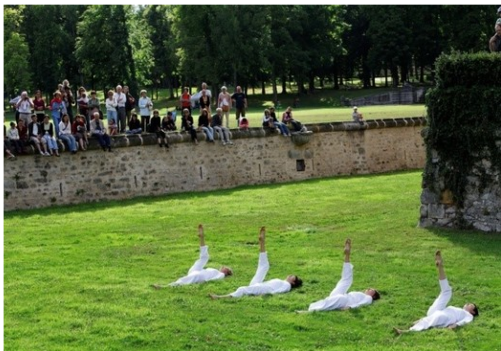
Рис. 2. Постановка «Первичное накопление» (Т. Браун)