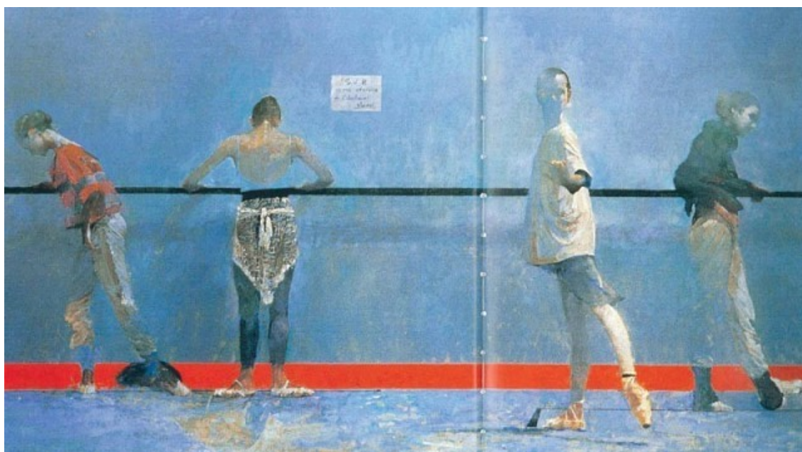
Рис. 5. Картина художника Роберта Хайндела