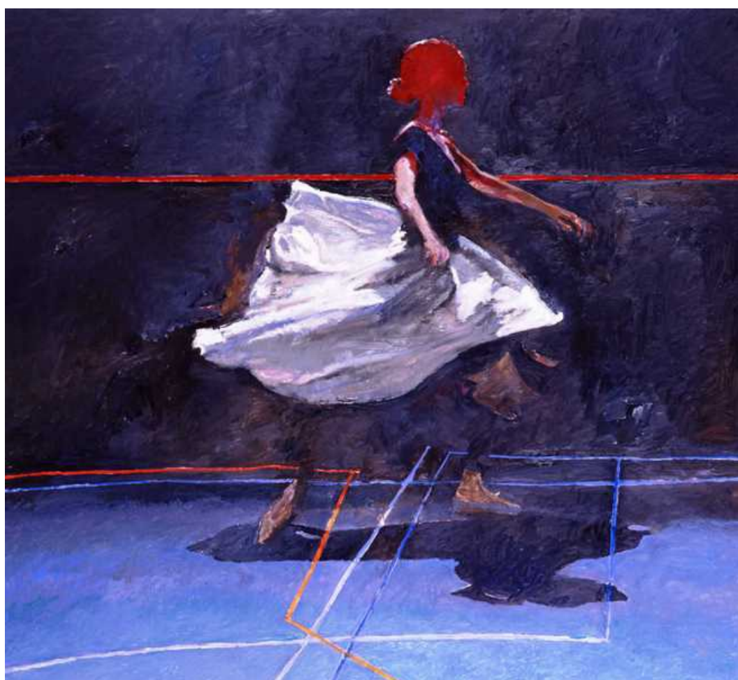
Рис. 4. Картина художника Роберта Хайндла