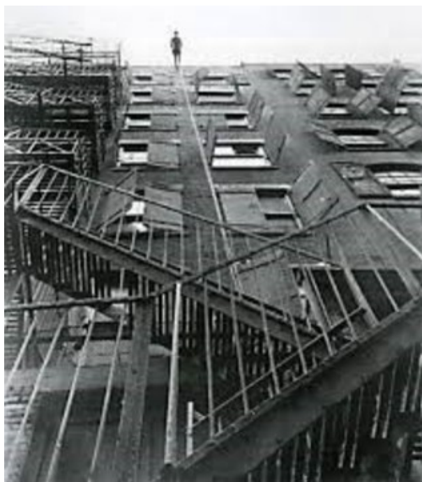
Рис. 3. Постановка «Человек идущий вниз по стене дома» (Т. Браун, 1970)