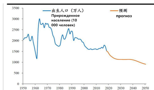
Рис. 2. Интернет-проект [U+300A] Население, родившееся в Китае в разные годы (1949-2019) [U+300B] 02.12.2019 http://www.caoss.org.cn/1article.asp?id=4659 (Дата обращения: 05.01.2021) Неожиданно эта сцена оказалась 11-летней давности.